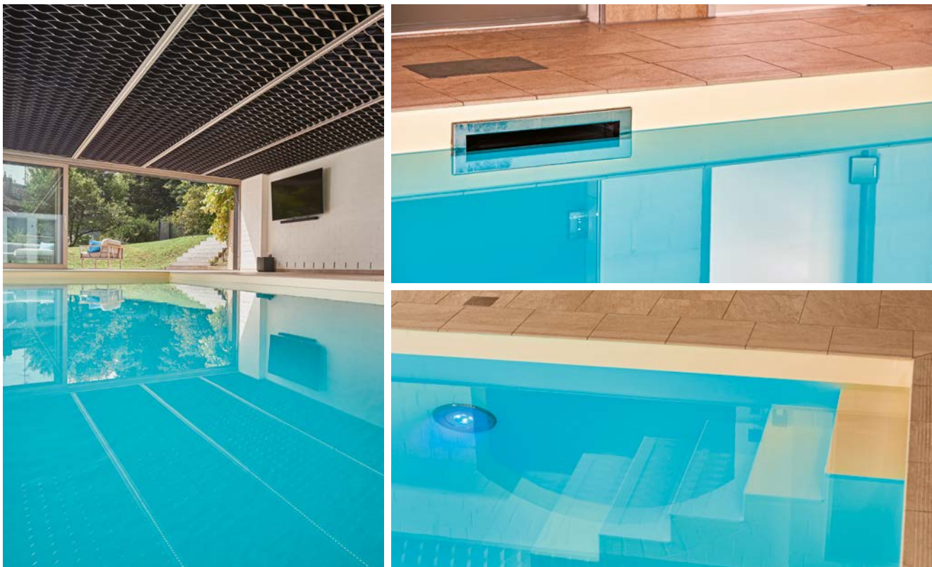
Links: Imposant ist die mächtige Decke mit ihrer wabenartigen Struktur. Rechts oben: Dank des superflachen Skimmers verfügt der Pool über einen relativ hohen Wasserspiegel. Links unten: Die vorhandene Folie war nicht mehr zu gebrauchen und wurde durch eine frische türkisfarbene ersetzt.

Die zwar vorhandene, aber nach der langen Standzeit nicht mehr brauchbare Klimatechnik ersetzten die Pool-Experten durch ein hoch energieeffizientes Gerät mit mehrstufiger Wärmerückgewinnung. Die ebenfalls nicht mehr nutzbare Pool-Technik wich einem modernen, vollautomatischen SSF-Premium-System. Die Wände waren hingegen schon mit einer Wärmedämmung mit Dampfsperre versehen und erhielten deshalb nur einen neuen Anstrich.