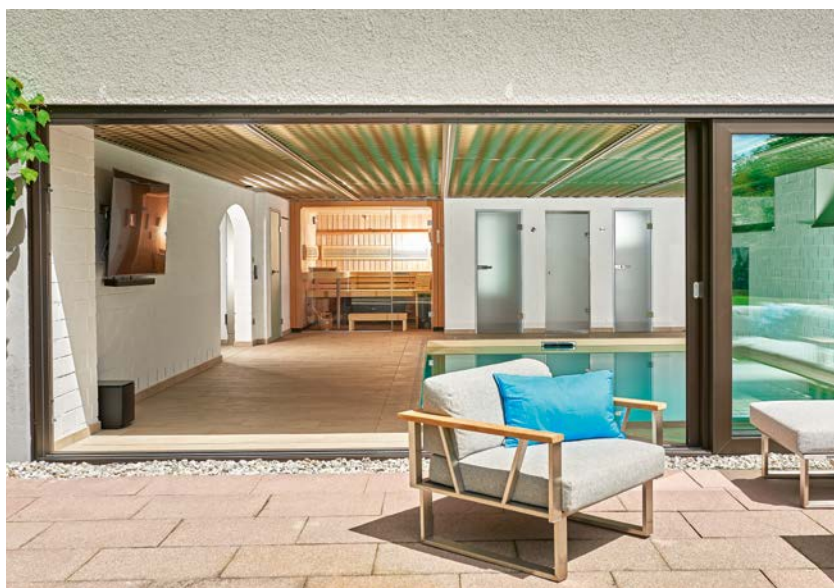
Eine bodentiefe Glasfront lässt viel Licht in die Schwimmhalle und hebt die Trennung von Innen- und Außenbereich auf.

Damit der Wasserspiegel deutlich höher kommt, baute SSF.Pools by KLAFS einen modernen, superflachen Skimmer aus Edelstahl und dazu passend neue Einbauteile mit Edelstahlblenden ein. Eine nachträglich in den bestehenden Beckenkörper betonierte Ecktreppe mit sechs Stufen ersetzte die alte Einstiegsleiter. Damit die Familie in ihrem Pool entspannende Massagen und sportliches Schwimmtraining auf der Stelle genießen kann, integrierten die Pool-Experten zu guter Letzt noch eine leistungsfähige Gegenstromanlage, natürlich ebenfalls mit Edelstahlblende, in der Querseite des Beckens. >>