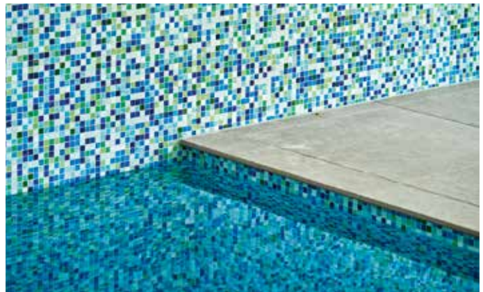
Bild oben rechts: Hier zeigt sich die saubere Verarbeitung der Beckenauskleidung inklusive der Verbindung zur Beckenumrandung aus Naturstein von Meyer Bauabdichtung.

Bild oben links: der Schwall aus der Wand. Mit dieser Kreation von SHS Schmierer lassen sich Nacken und Schulterpartien massieren.