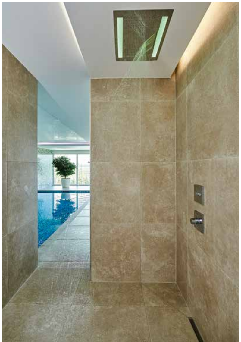
Bild rechts: die moderne Erlebnisdusche mit großformatigen Natursteinfliesen.

Über diese Schlitzschienen wird die entfeuchtete und erwärmte Luft in die Schwimmhalle zurückgeführt, wo sie dann für ein angenehmes Raumklima sorgt.