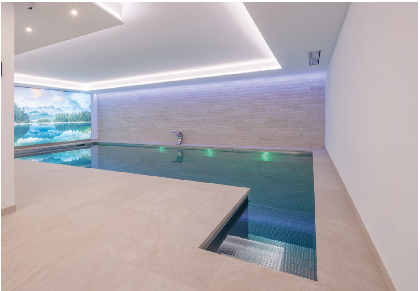
Hinterleuchtete Fotowand, indirekte Beleuchtung, Fliesen und Naturstein – das ist das stimmige Ambiente für den Edelstahlpool mit integrierter Treppe.