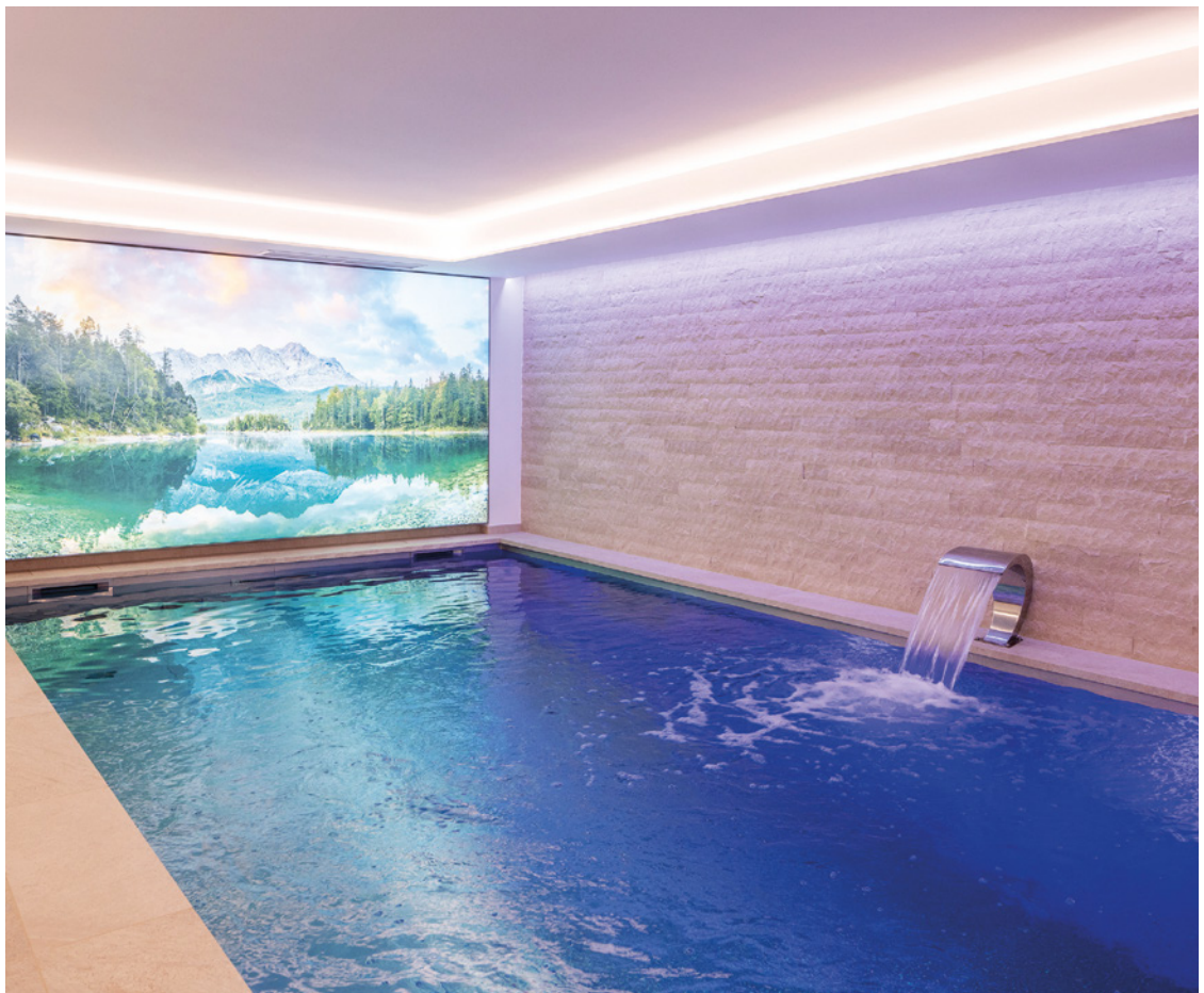
Die Kanäle der Lüftungsanlage sind elegant hinter den beleuchteten Deckenabhängungen verborgen.