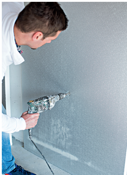
4 – 6 Um die Luftdichtheit zu gewährleisten, dürfen nur die Systemkomponenten verwendet werden.