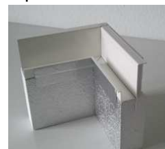
Spezielle Eck-Elemente je nach Einbau-Situation